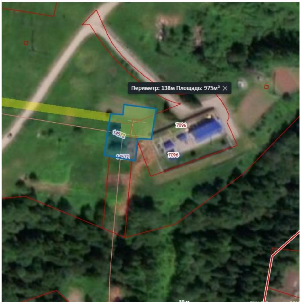
Схема для разработки проекта планировки и проекта межевания части территории п. Сылва Сылвенского сельского поселения Пермского муниципального района Пермского края, включающей земельные участки с кадастровыми номерами 59:32:0050027:13712 и 59:32:0050027:14572